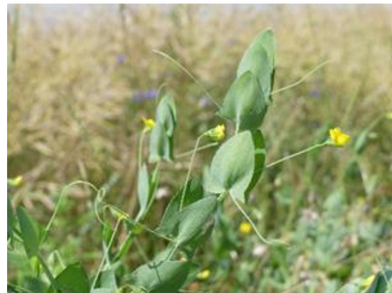
Ranken-Platterbse ( Lathyrus aphaca ), Melerfeld

Für diese Zielarten werden spezifische Massnahmen ergriffen, was auch vielen anderen Arten hilft. Der weiche Lössboden ist ideal geeignet für grabende Wildbienen, seltene Ackerkräuter und vermutlich auch für die Kreuzkröte.