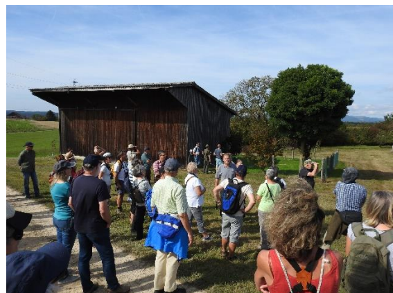
Birdlife AG im Melerfeld: Auch Feldscheunen können für die Biodiversität interessant sein.

Noch fehlende Resultate aus der Erfolgskontrolle folgen erst in ein paar Jahren, da BiM erst am Anlaufen ist.