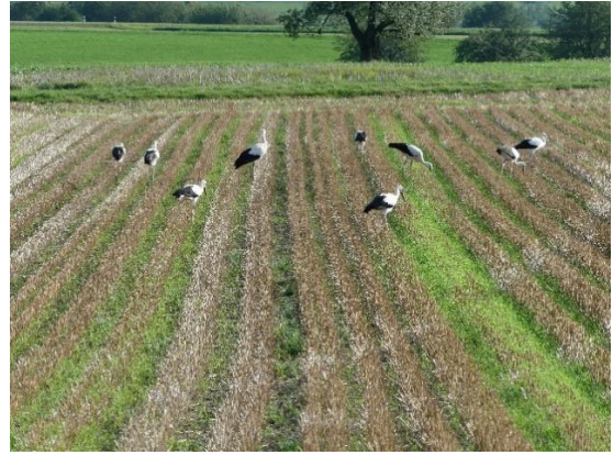
Ein abgeerntetes Getreidefeld mit weiter Saat scheint auch für die Störche interessant zu sein

Die Anlage von Getreidefeldern mit weiter Saat soll Feldlerche, Feldhase und unter Umständen auch die Ackerflora fördern. Diese neue, beitragsberechtigige Bewirtschaftungsform ist dank grosszügiger Entschädigung eines allfälligen Ernteverlustes gut angekommen bei den Bauern, nicht zuletzt, weil sie weiterhin Lebensmittel produzieren können.